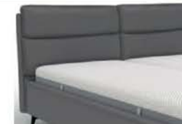
22990 mit Kappnaht Höhe 95 cm / bodenfrei nur lieferbar bei Bettgrößen 160/180/200 cm Breite