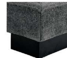
S101-13 S101-18 Sockel schwarz gegen Aufpreis