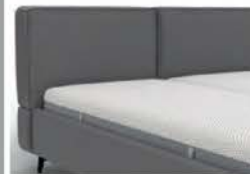
22994 mit Kappnaht Höhe 91 cm / bodenfrei nur lieferbar bei Bettgrößen 160/180/200 cm Breite