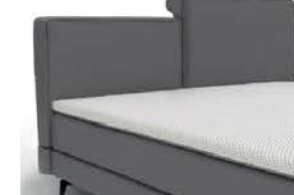
22194KV mit Kappnaht gegen Aufpreis Höhe 79/93 cm / bodenfrei nur lieferbar bei Bettgrößen 160/180/200 cm Breite und mit Unterbau glatt 16cm Höhe