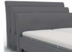
22968S - Höhe 99 cm 22968M - Höhe 109 cm 22968L - Höhe 119 cm mit Kappnaht / bodennah