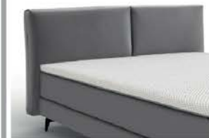
22144 mit Kappnaht Höhe 89 cm / bodenfrei