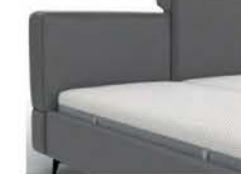
22994KV mit Kappnaht/ gegen Aufpreis Höhe 91 cm / bodenfrei nur lieferbar bei Bettgrößen 160/180/200 cm Breite