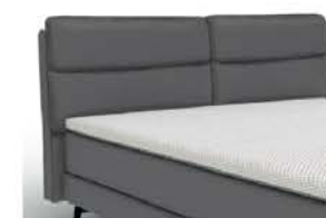
22190 mit Kappnaht Höhe 95 cm / bodenfrei nur lieferbar bei Bettgrößen 160/180/200 cm Breite