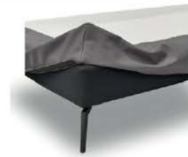
Husse mit Klettverschluss