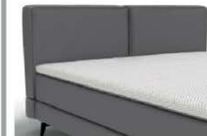
22194 mit Kappnaht Höhe 79 cm / bodenfrei nur lieferbar bei Bettgrößen 160/180/200 cm Breite und mit Unterbau glatt 16cm Höhe