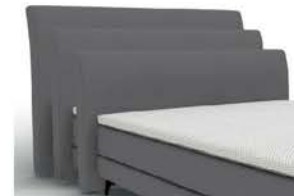
↳ 22168S - Höhe 99 cm ↳ 22168M - Höhe 109 cm ↳ 22168L - Höhe 119 cm mit Kappnaht / bodennah