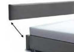
22924 / 22929 - gegen Aufpreis mit Kappnaht / bodenfrei Höhe 24 / 29 cm Kopfteil-Blende für Bettgestell 24 cm bzw. 29 cm Höhe