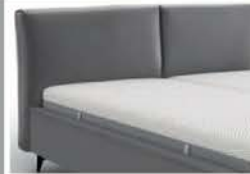
22944 mit Kappnaht Höhe 89 cm / bodenfrei