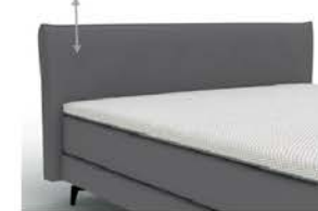
23103 Multimaß mit Biese Höhe 102 cm / bodenfrei in 5 cm-Schritten kürzbar