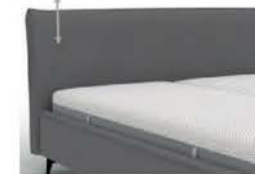
23903 Multimaß mit Biese Höhe 37-107 cm / bodenfrei in 5 cm-Schritten kürzbar