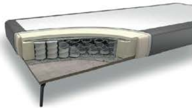
Unterbau „glatt“ mit Taschenfederkern und Husse GL16