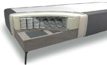
Unterbau „glatt“ mit Taschenfederkern und Husse GL25